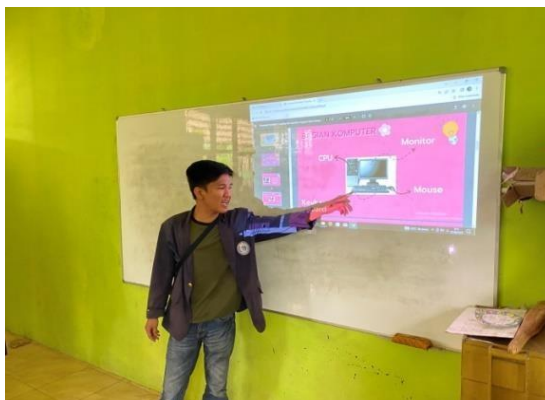
Gambar 1. Sosialisasi Pengenalan Microsoft Word

Sosialisasi ini dilakukan pada hari Senin, 13 Mei 2024 dengan peserta yaitu siswa-siswi kelas 6 SDN 1 Srikaton yang berjumlah 30 (tiga puluh) orang. Pada tahap ini instruktur memberikan presentasi mengenai teori microsoft office dasar, seperti fungsi dokumen, toolbar, dan insert gambar. Selain itu, dilakukan sosialisasi tentang aplikasi Canva yang bertujuan untuk sarana belajar-mengajar bagi guru, content marketing bagi sekolah, dan pengenalan visual teknologi bagi siswa-siswi, seperti pada gambar 1 dan 2.