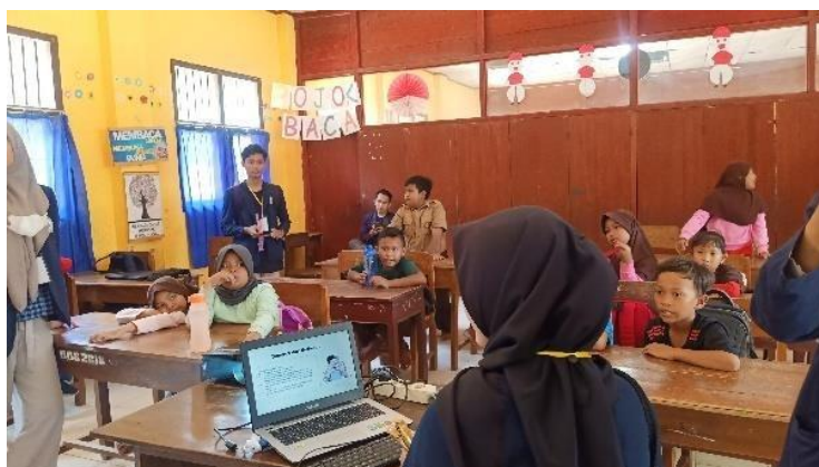
Gambar 2. Sosialisasi Pengenalan Aplikasi Canva