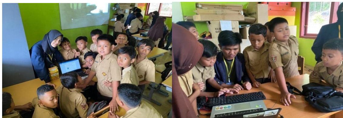
Gambar 3. Demonstrasi dan Praktek