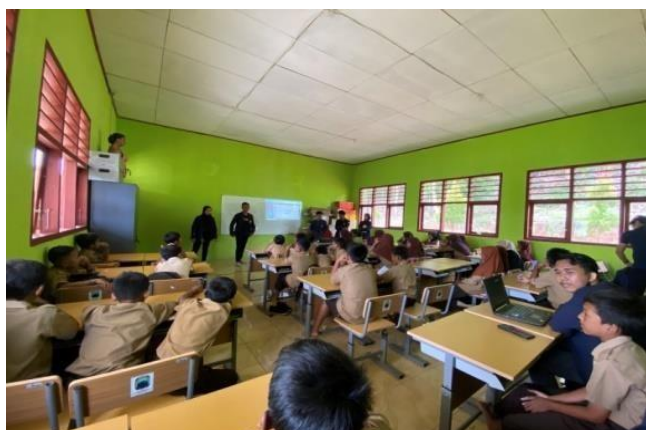
Gambar 5. Evaluasi Pelatihan

Selanjutnya akan dilakukan evaluasi di akhir sesi pelatihan untuk mengukur pemahaman dan keterampilan peserta serta memberikan umpan balik konstruktif kepada peserta berdasarkan hasil evaluasi seperti pada gambar 5.