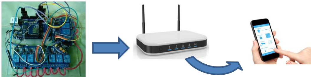
Gambar 3.1 Framework Sistem Smart Building

Dalam bab ini dibahas hasil yang telah dicapai hingga saat ini, serta hambatan yang ditemui selama pengerjaan penelitian. Gambar 3.1 menunjukkan framework yang digunakan pada penelitian ini