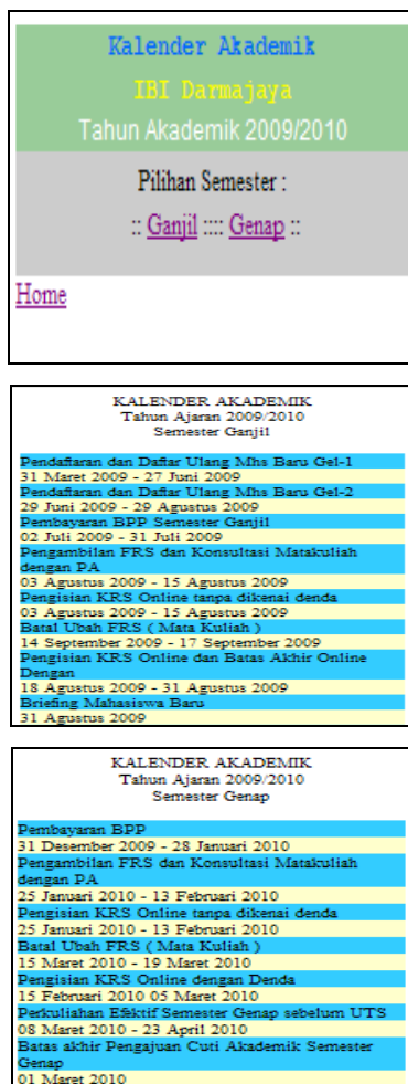
Gambar 6. Tampilan Halaman Kalender Akademik

Halaman Kalender Akademik, Halaman ini menampilkan kalender akademik sesuai dengan semester yang diinginkan. Halaman kalender akademik dapat dilihat pada Gambar 6.