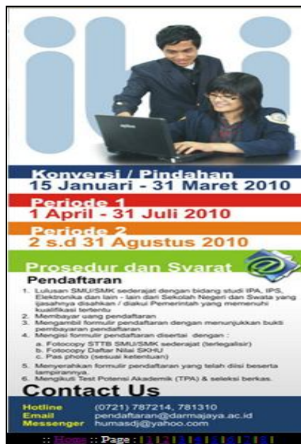
Gambar 5. Tampilan Halaman brosur digital