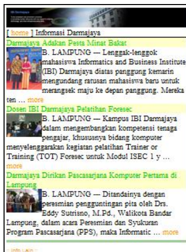
Gambar 2. Tampilan Halaman Informasi Kampus

Tampilan halaman Informasi Kampus , Untuk melihat informasi kampus cukup memilih hyperlink yang tersedia yaitu “Informasi Kampus”. Tampilan halaman seperti terlihat pada gambar 2.