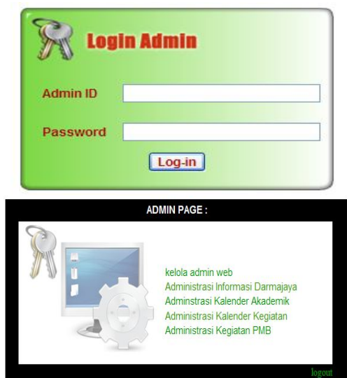
Gambar 4.8. Tampilan Halaman Administrator.

digunakan untuk manajemen dan mengupdate informasi mobile website. Pada halaman ini terdapat hyperlink yang menghubungkan ke menu pengelolaan mobile website, diantaranya : kelola info, kelola kuisisioner, update biaya mahasiswa, update biaya sks, kelola pendaftaran, kelola konfirmasi bayar dan masuk admin ujian. Gambar 8 merupakan tampilan halaman menu admin.