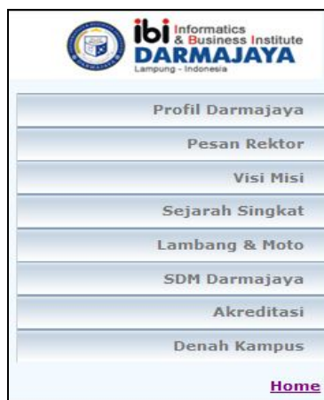
Gambar 3. Tampilan Halaman Profil Kampus

Tampilan Profil Kampus , Pada halaman ini terdapat beberapa submenu terkait dengan profil kampus. Gambar 4.3 adalah tampilan halaman profil kampus