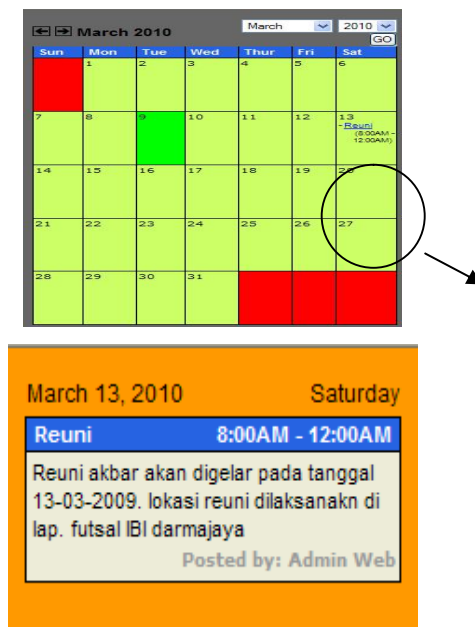
Gambar 7. Tampilan Halaman Kalender Kegiatan

Menampilkannya disajikan dalam bentuk kalender. Untuk melihat detail aktifitas dapat mengklik judul kegiatan yang terdapat pada tanggal terkait. Halaman Kalender Kegiatan dapat dilihat pada Gambar 7.