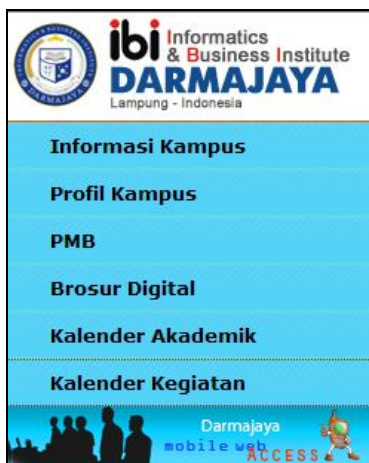
Gambar 1. Tampilan Menu Utama

dilakukan adalah dengan mengklik text hyperlink yang ada. Secara lengkap hyperlink yang terdapat pada halaman utama adalah : Informasi Kampus, Profile Kampus, PMB, Brosur Digital, Kalender Akademik, dan Kalender Kegiatan. Tampilan halaman utama dapat dilihat pada gambar 1.